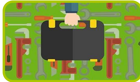
Praktische Tools und Leitlinien