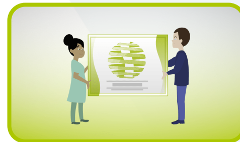
Wettbewerb für gute praktische Lösungen