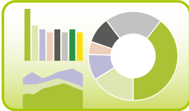
Fakten und Zahlen